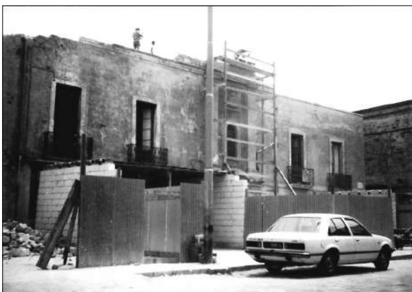
Mesagne 1970. Si demolisce la sede della ex Pretura, oggi Biblioteca