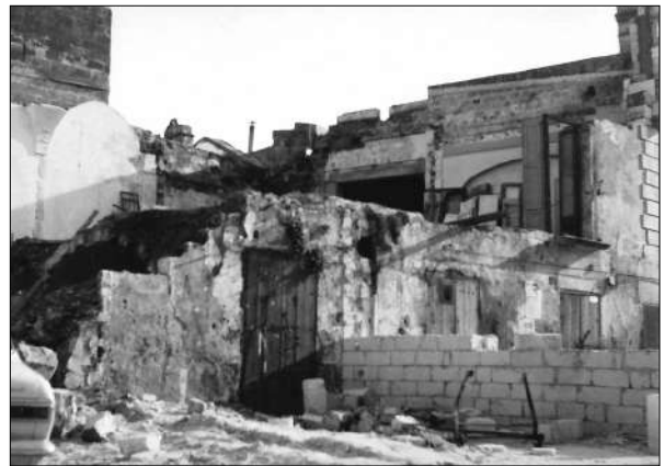
Mesagne 1970. Si demolisce la sede della ex Pretura, oggi Biblioteca