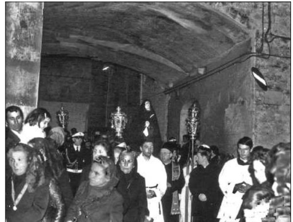
Processione dei misteri (13 aprile 1979)

Questa è la luce della fede in Cristo che è fede pasquale di croce e di resurrezione, eco della prima creazione, compimento della nuove, protesa verso il ritorno glorioso di Gesù, re e signore della storia, alla fine dei tempi.