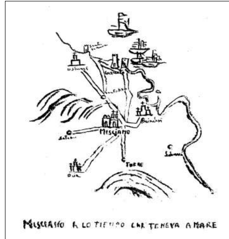
(ms. nell'Archivio Capitolare)

La città di Mesagne ha una forte tradizione legata alla cultura contadina e questa a sua volta è in rapporto stretto con il mare e la villeggiatura estiva. In particolare, c'è un lido storico degli anni '50 e '60, posto in prossimità della RSN (leggi Riserva Naturale Statale) di Torre Guaceto, in località Apani, legato alla memoria e all'identità dei mesagnesi ed entrato ormai