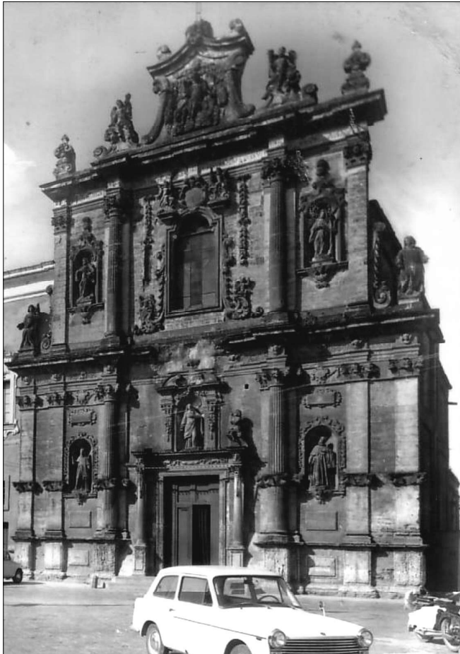
«Ci passi ti la Porta Picciula...»

“Ricordare è oggi un gesto di educazione, una sfida personale alla dittatura del presente che ci fa tutti informati e distratti, condannati a oblio repentino”.